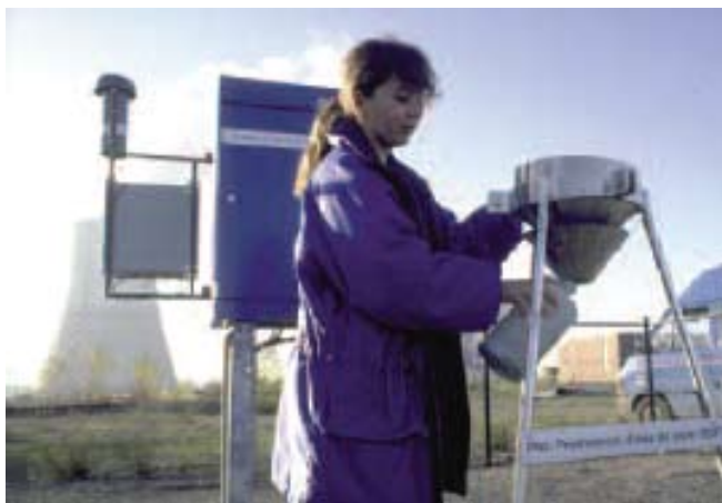
Figure 2 : Prélèvement dans l'environnement.

Depuis février 2009, toutes les mesures de tritium sont réalisées selon les normes internationales en vigueur pour ce radionucléide par des laboratoires agréés par l'ASN selon la norme ISO 17025 (référentiel adopté par l'ASN dans le cadre du Réseau National de Mesure). Ces données figurent dans les registres réglementaires mensuels aux côtés de nombreuses autres mesures de radioactivité de l'environnement et seront disponibles et accessibles au public sur le site Internet du Réseau National de Mesure dès janvier 2010 (sur http://www.mesure-radioactivite.fr ).